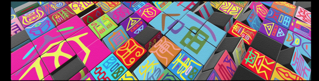
Another Journey of Hundred Wishes