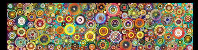
Milky Way Blossom