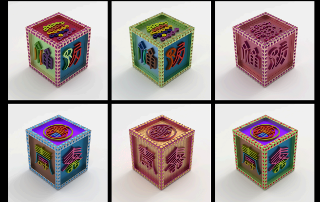
Metaverse Gallery : Immersive Artworks